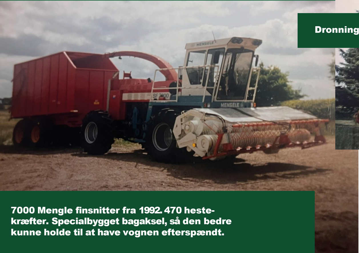
7000 Mengle finsnitter fra 1992. 470 hestekræfter. Specialbygget bagaksel, så den bedre kunne holde til at have vognen efterspændt.