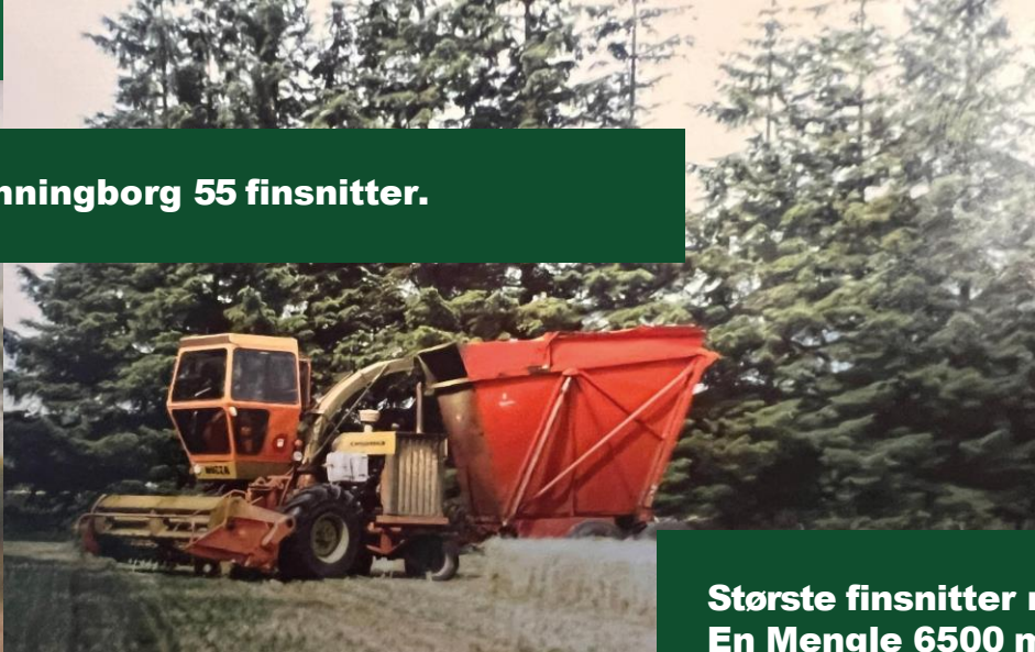
Dronningborg 55 finsnitter.